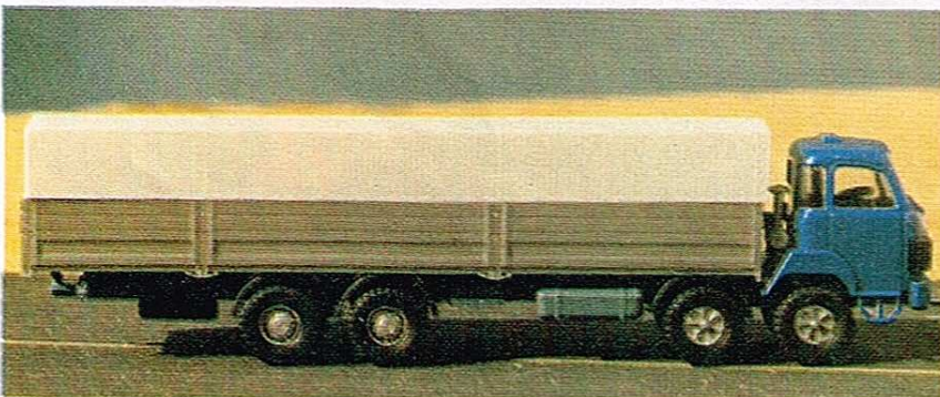
406 4-Achser mit Pritsche und Plane