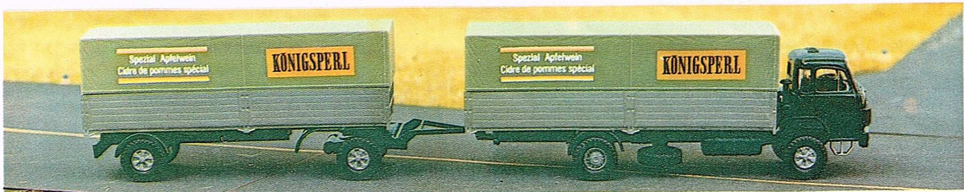
408 2-Achser mit Pritsche, Plane und 2-Achs-Hänger (hier mit angebrachten Abziehbildern aus Nr. 495)