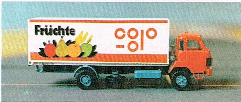
404 2-Achser mit Kastenaufbau