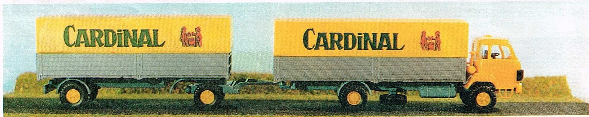
419 Lastzug „Cardinal“, Brauereifahrzeug, mehrfarbig bedruckt