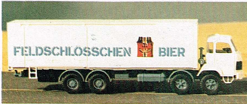
401 4-Achser mit Kastenaufbau u. seitlichen Türen

Einige der umseitig aufgeführten SAURER-Modelle: