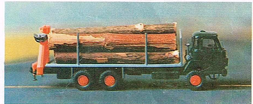
405 3-Achser, Holztransporter mit Ladekran (ohne Holz)