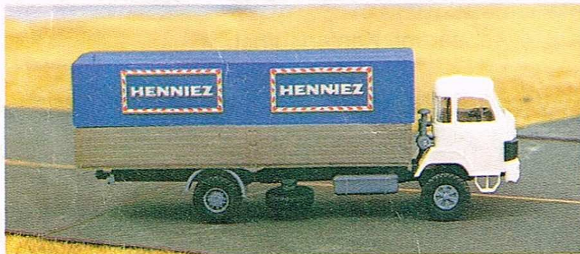
417 2-Achser „Henniez“ Mineralwasser