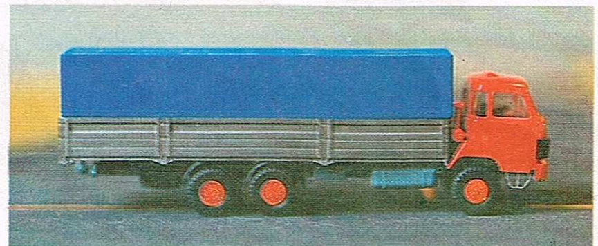
407 3-Achser mit Pritsche und Plane