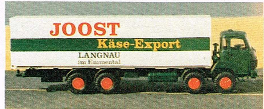
402 4-Achser mit Kastenaufbau